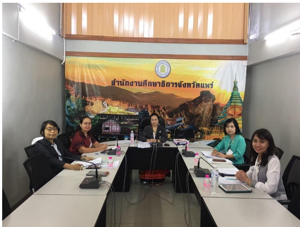
๑๖.๒ การนิเทศ ติดตามการจัดการศึกษาโรงเรียนเอกชน ภาคเรียนที่ ๒/๒๕๖๕