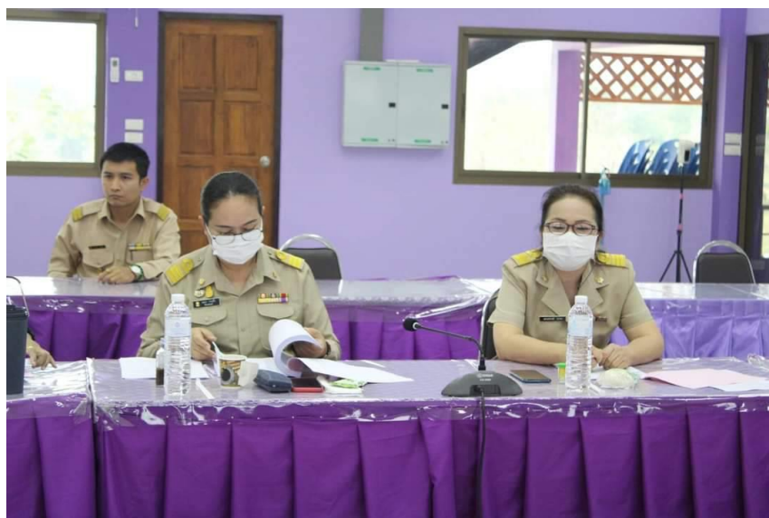
๑๖.๒ การประชุมคณะกรรมการพัฒนาการจัดการศึกษาเด็กปฐมวัยในระดับพื้นที่จังหวัดแพร่และการประชุมเชิงปฏิบัติการปรับปรุงแผนการพัฒนาการศึกษาปฐมวัยจังหวัดแพร่ พ.ศ. ๒๕๖๔ - พ.ศ. ๒๕๗๐ และข้อมูลสารสนเทศ เด็กปฐมวัย