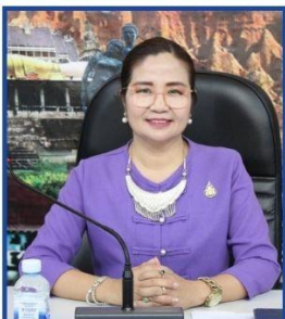
นางรุ่งทิพย์ ทาวดี ศึกษาธิการจังหวัดแพร่