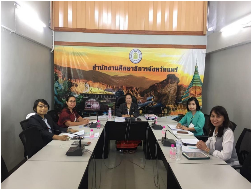
๑๖.๒ การนิเทศ ติดตามการจัดการศึกษาโรงเรียนเอกชน ภาคเรียนที่ ๒/๒๕๖๕